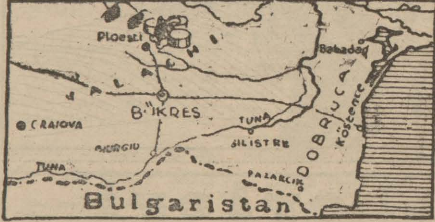
Romanyada Almanların nüfuz ettikleri söylenen muntakaları gösterir harita

Vaşington 8 (A.A.) — Royter: Sovyet Rusya büyük elçisi Oumaraki dün aksam hariciye nazırı muavini Sumner Welles ile bir görüşme yapmıştır. Bu suretle yazın yapılmış olan diplomatik konuşmalar anı surette gene başlanmıştır.